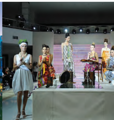
Presentación de cultura uzbeka organizada por el Fund Forum en el Ayuntamiento de Viena. Vista de Tashkent. Semana del Diseño y de la Moda de Tashkent.