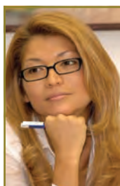
Gulnara Karimova Fundadora/ Presidenta Fund Forum

“En Uzbekistán hay muchos jóvenes con talento que necesitan una oportunidad para convertirse en personas seguras de sí mismas a edades tempranas”, explica Gulnara Karimova, fundadora y presidenta del Fund Forum, ex alumna de Harvard y empresaria de gran éxito. “Nuestros apasionantes e innovadores proyectos inspiran a la