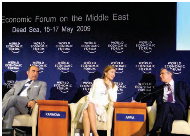
Foro Económico Mundial sobre el Oriente Medio, mayo 2009.

gente joven de muchas maneras, ofreciéndoles un entorno divertido en el que pueden disfrutar a la vez que ganan en confianza en sí mismos y desarrollan sus talentos y habilidades naturales”.